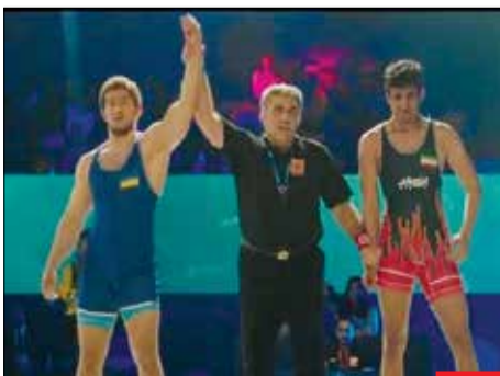
مغز غریب‌زده! در شبکه نمایش خانگی کشورمان، نماینده اوکراین یکی از بهترین کشتی‌گیرهای ما را در حالی شکست می‌دهد که در واقعیت، اوکراین کلاً سه مدال طلای المپیک داره و هیچ‌وقت حتی در حد یک حریف برای ایران نبوده است!