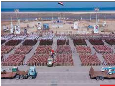
وعده انتقام آحر! نیروهای مسلح یمن با برگزاری رژه نظامی، موشک‌های جدیدی را رونمایی کردند تا خط و نشان تازه‌ای برای ائتلاف متجاوز سعودی-اماراتی باشد. این مراسم بزرگ‌ترین مراسم فارغ‌التحصیلی نیروهای نظامی دولت نجات ملی یمن بود که با نام رژه وعده آخرین انتقام برگزار شد.