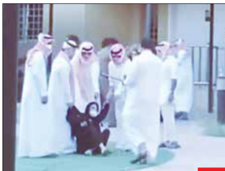
هیس، دخترها فریاد نمی‌زنند! در عربستان سعودی دختران یک پتیم‌خانه به دلیل شرایط بد، به اعتصاب غذا دست می‌زنند که نتیجه‌اش می‌شود خشونت و شکنجه دختران به دست ده‌ها نفر از مأموران! آیا سعودی‌نشان این تصاویر را منتشر خواهد کرد یا اینکه این اتفاقات در ایران فقط جذاب است؟