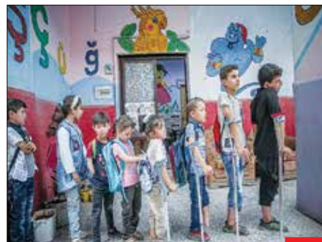
در جست‌وجوی آینده! تصویری دردناک از شرایطی که کودکان سوری قد می‌کشند و بزرگ می‌شوند. جنگ برای کودکان تماماً باخت است و کودکان سوری، یعنی... و... بازیچه قدرت‌طلبی دیگران می‌شوند. به امید پایان جنگ و خونریزی در همه جای دنیا