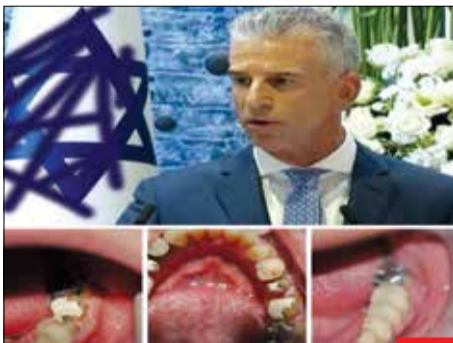
وزیریت رایگان! گروهی از هکرها تلفن همراه رئیس موساد را هک و تصاویری از دندان‌های او را منتشر کردند. اوضاع دندان‌های دیوید بارنیا آنچنان خوب نیست و اگر می‌خواهد عمر دندان‌هایش بیشتر از عمر رژیم صهیونیستی باشد، روزی دو بار مسواک به او پیشنهاد می‌شود!