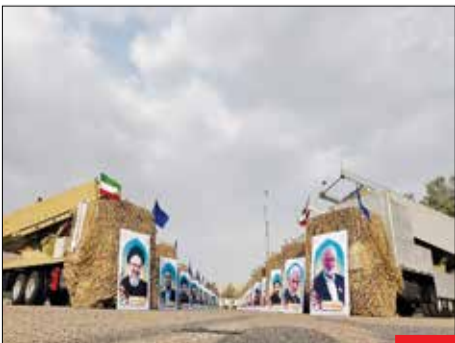
نیروی دریایی آماده‌تر از همیشه؛ با حضور سرلشکر سلامی، فرمانده کل سپاه پاسداران انقلاب اسلامی ۲۶۴۰ سامانه موشکی، پهپاد و دیگر ادوات به سازمان رزم نیروی دریایی سپاه الحاقی شد.