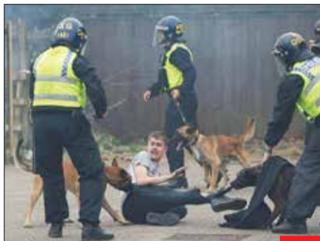
پادشاه سگ‌ها؛ حمله سگ‌های پلیس انگلیس به مردی در جریان نظاره‌ها ضد مهاجرتی در روترهام انگلیس را مشاهده می‌کنید. سگ‌های پادشاه رحم ندارند!