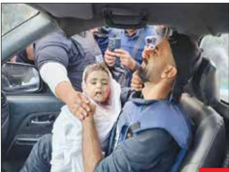
سخت جدیت/ خبرنگاری در غزه که به جای میکروفون، فرزند شهید را در دست گرفته است. این داغ با چه چیزی جز نابودی صهیونیست‌های وحشی خاموش می‌شود؟