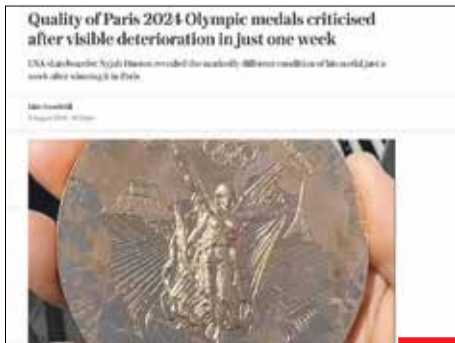
Made in France? کیفیت مدال‌های المپیک صدای همه ورزشکاران را درآورده است! مدال‌هایی که یک هفته نشده در حال اکسید شدن هستند.