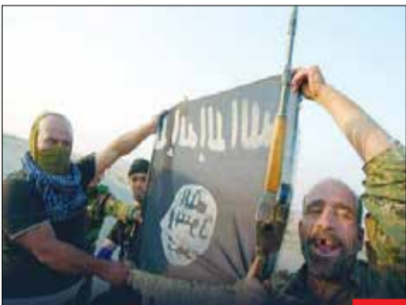
دم خروس بیرون زد/ با روی کار آمدن «جولانی» در سوریه معلوم بود که سرآخر دم خروس داعش‌پرو بیرون خواهد زد. این روزها داعش، با سرگردگی «ابو دجانة الجبوری» در حلب سر برآورده است.