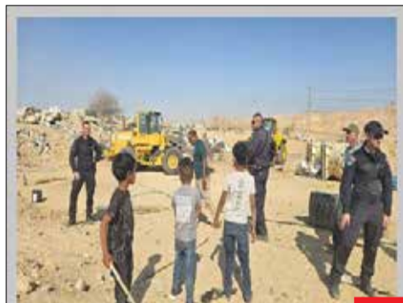
بچه‌های مقاومت/ فلسطین مهد مقاومت شده، در نقب اشغالی، وقتی بلدوزرهای رژیم برای تخریب خانه‌های خانواده «ابوالمسک» پیش‌روی می‌کردند، کودکان این‌گونه چوب در دست، مقابل اشغالگران ایستادند.