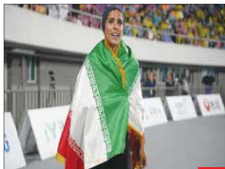
دختر بلندی‌رواز ایران/ «ریحانه مبینی» ملی‌پوش دوومیدانی ایران زمین توانست در جریان رقابت‌های قهرمانی دوومیدانی آسیا با ثبت پش به طول ۵/۴۰ متر نخستین مدال طلای تاریخ ورزش زنان در ماده پش طول را کسب کند.