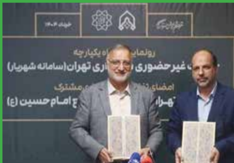
تهران در راستای پایش از حریم پایتخت اظهار کرد: «در تلاش هستیم تا برای صیانت از حریم شهر تهران کمک کنیم. هر شهری

حسینی‌آهنگر ادامه داد: «در تصاویر سه بعدی از حریم پایتخت کمک جدی و هوشمندی جهت اشراف و پایش منظم حریم تهران خواهد شد. کاری که در حال شروع آن هستیم یک قرارداد ۱۴ ماهه است؛ البته سامانه ما آماده است، ولی تهیه داده برای شهر تهران و عکس‌های هوایی از حریم پایتخت در حال انجام است.»