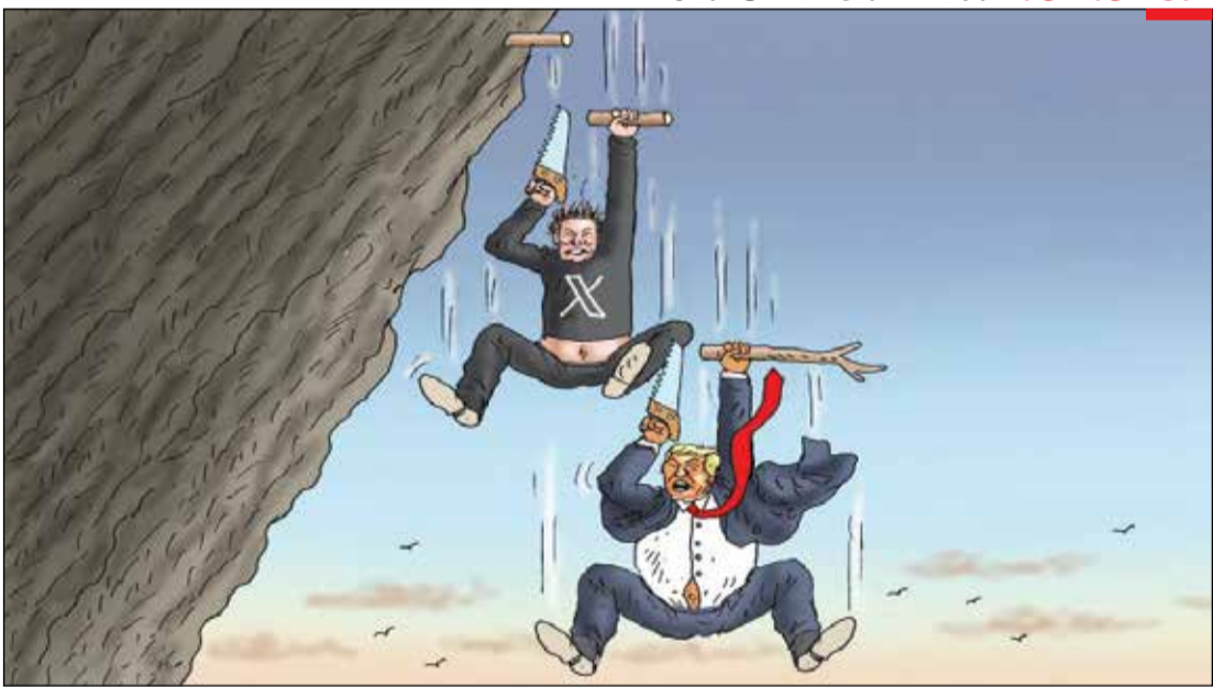
دعوی‌احمق و احمق‌ترا! کارتونیست: ماریان کامینسکی/اتریش