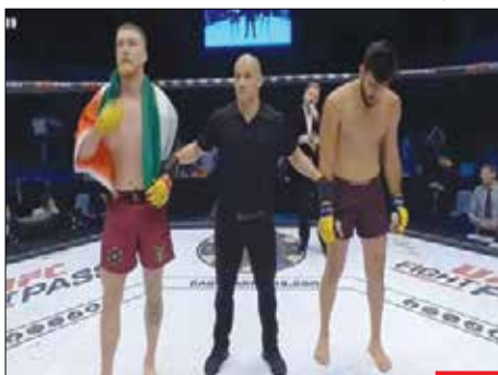
برای فلسطین/ «پادی مک‌کور» مبارز رزمی‌کار ایرلندی با شکست دادن رقیب مهبونیست خود در رقابت‌های رزمی در رم، پرچم فلسطین را بالا برد و فریاد زد: «فلسطین آزاد، فلسطین آزاد»