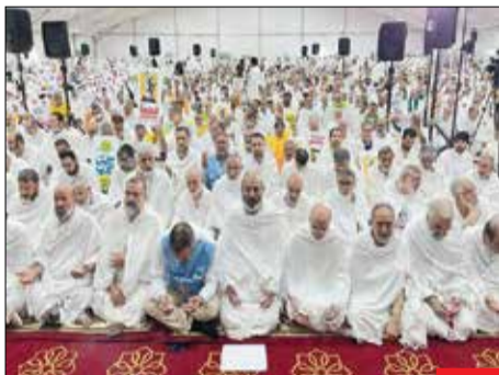
مبارزه با استکبار/ زائران ایرانی در چادر بعثه رهبر معظم انقلاب در عرفات با پلاکاردهایی با شعارهای «القدس لنا»، «مرگ بر آمریکا»، «مرگ بر اسرائیل»، «ان‌الله‌ا‌یحب‌المعتدین»، حضور پیدا کردند.