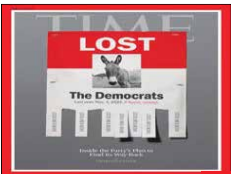
گمشده/ مجله «تایم» با انتشار تصویر الگ که نماد حزب دموکرات آمریکا است، کتابچه زده که دموکرات‌ها گم شده است، این حزب پس از شکست در سال ۲۰۲۴، در حال تجدیدنظر در همه چیز است.